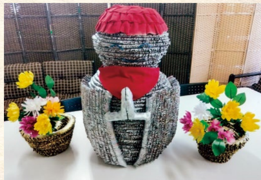
さぬき市 三谷 豊和