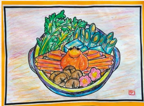
さぬき市 筒井 静子